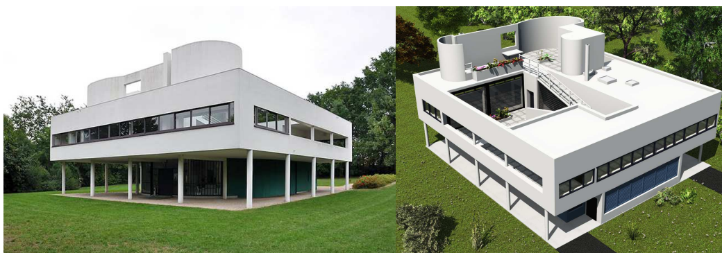
Le Corbusier, Ville Savoie , 1931