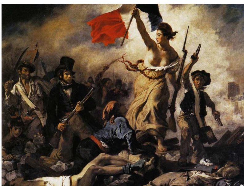
Eugène Delacroix, La llibertat guiant el poble , 1830