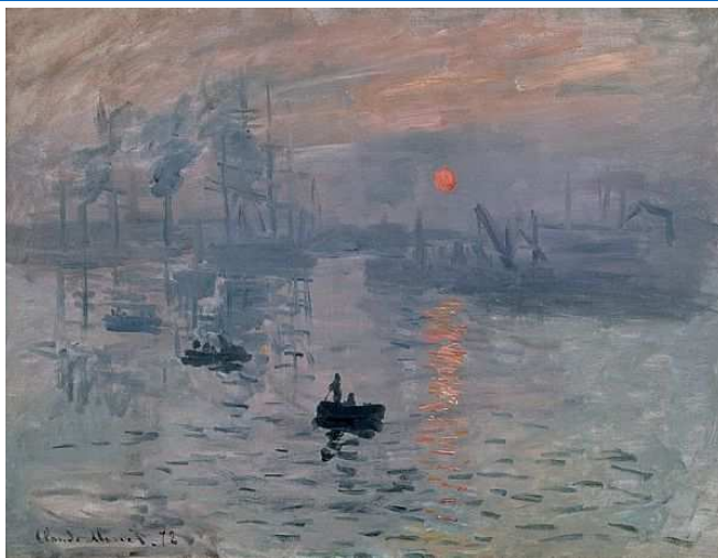
Claude Monet, Impressió. Sol naixent , 1872

B. Relaciona aquestes dues obres: J. Pollock, Autumn Rhythm (number 30) , 1950; F. Bacon, El papa Innocenci X , 1953.