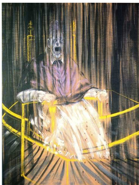
F. Bacon, El papa Innocenci X , 1953