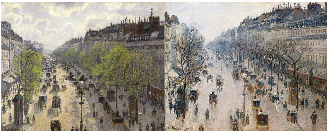
C. Pissarro, El boulevard de Montmartre, primavera / El boulevard de Montmartre, hivern , 1897

A. Relaciona els orígens de la fotografia amb la pintura impressionista a partir d'aquests quadres de Pissarro.