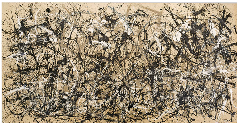
J. Pollock, Autumn Rhythm (number 30) , 1950

B. Relaciona aquestes dues obres: J. Pollock, Autumn Rhythm (number 30) , 1950; F. Bacon, El papa Innocenci X , 1953.