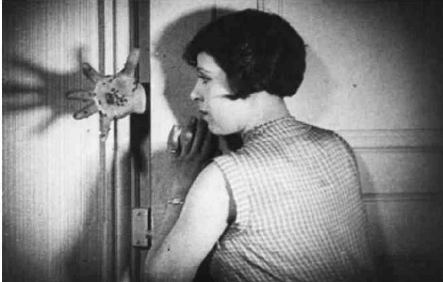
Un chien andalou , Luis Buñuel, Salvador Dalí, 1929

B. El surrealisme a la pintura i el cinema: Un chien andalou , Luis Buñuel, Salvador Dalí, 1929. Característiques del surrealisme com a moviment artístic, de la pel·lícula com a exemple de manifestació cinematogràfica del surrealisme i de col·laboració entre Dalí i Buñuel.