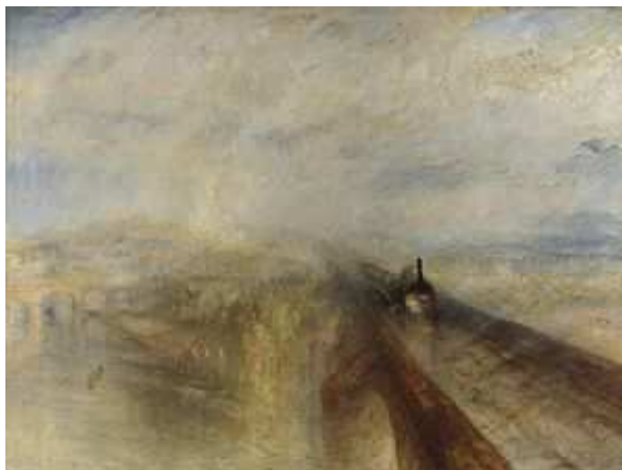
William Turner, Pluja, vapor, velocitat , 1844

A. Relaciona aquestes dues obres: Pluja, vapor, velocitat , William Turner; Impressió. Sol naixent , Claude Monet: